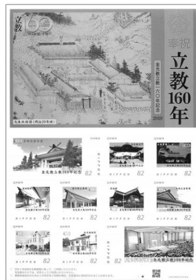
立教 160 年奉祝記念切手

【「あいよかけよ」誌 No.522 (2019.3)、No.523 (2019.4)、No.524 (2019.5) No.531 (2019.12) に掲載】