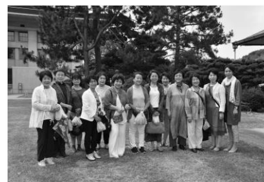
研修会に参加したメンバー