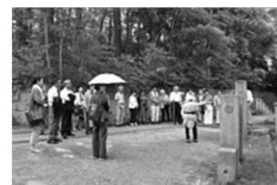
ご霊地聖跡めぐり